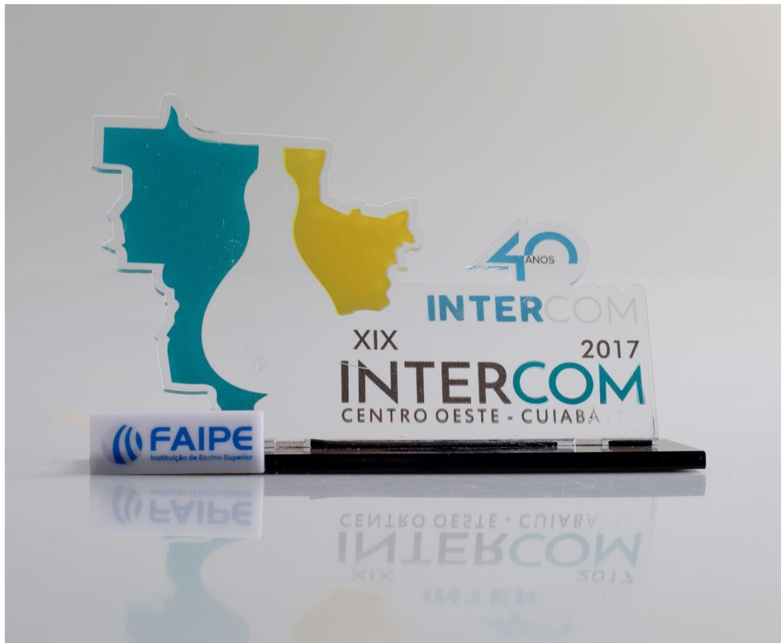
Troféu - Intercom 2017