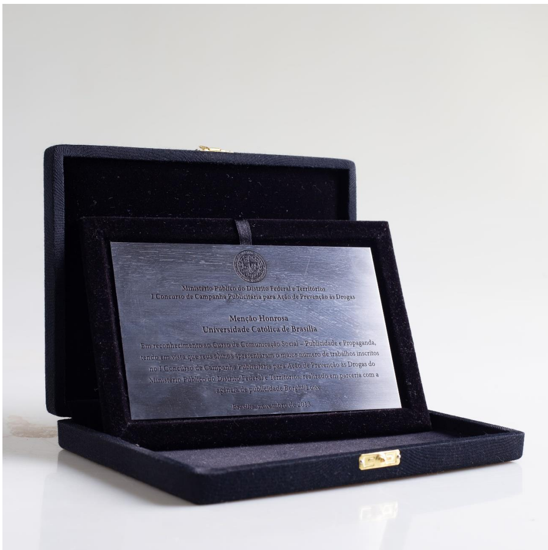
Troféu - MPDFT Menção Honrosa - 1º Concurso de Campanha Publicitaria para Ação de Prevenção às Drogas 2013