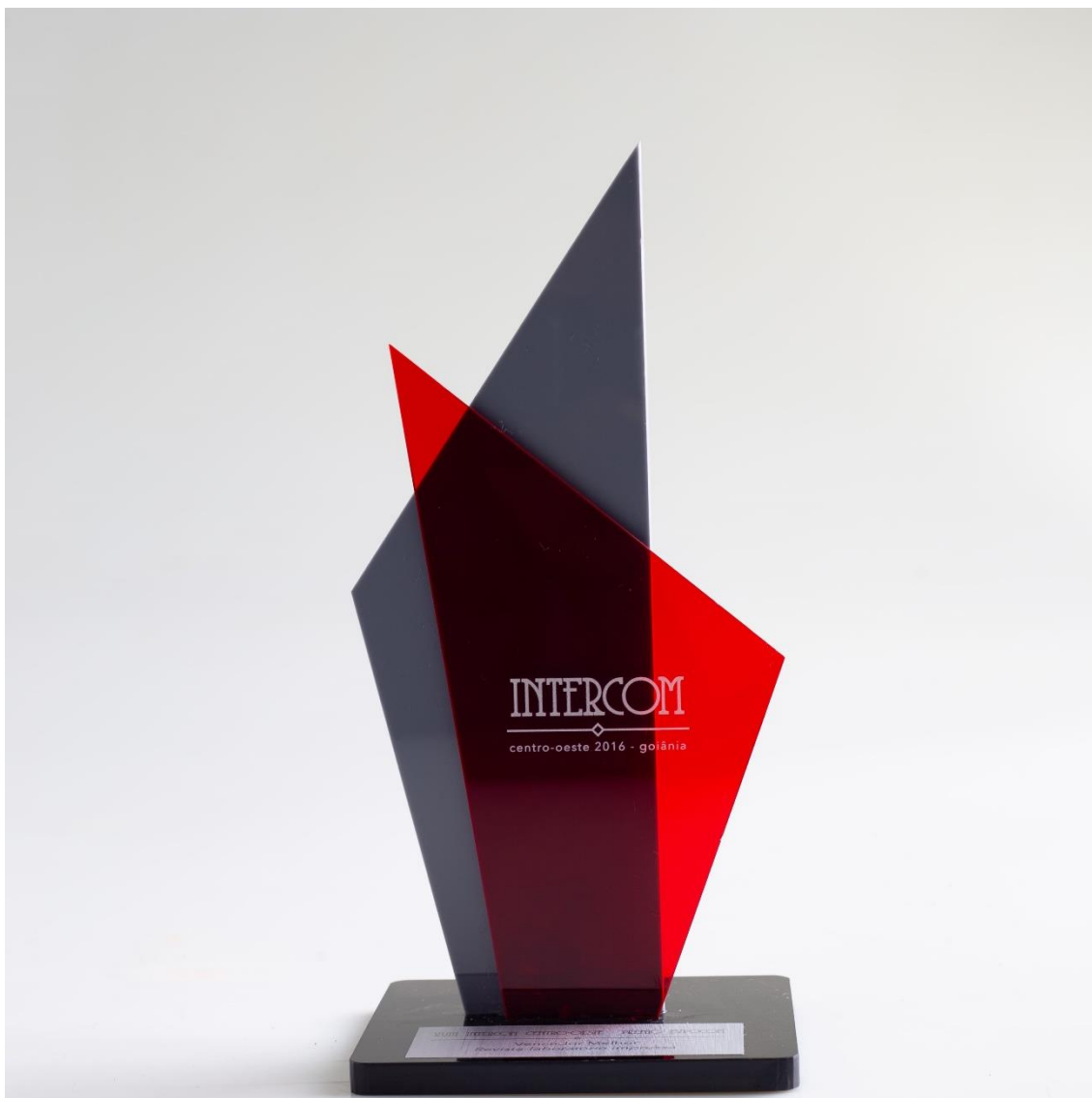
Troféu - Intercom 2016