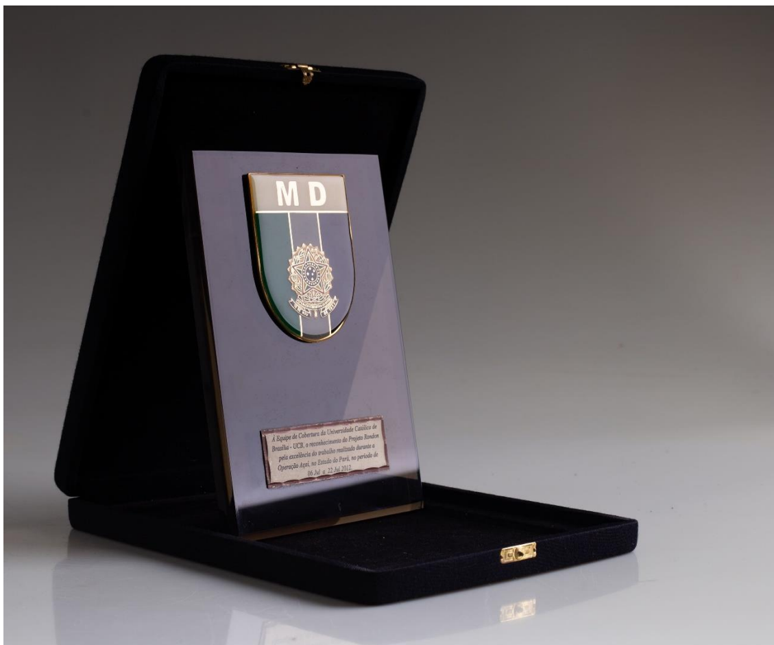
Troféu - Reconhecimento do Projeto Rondon - Equipe de Cobertura 2013