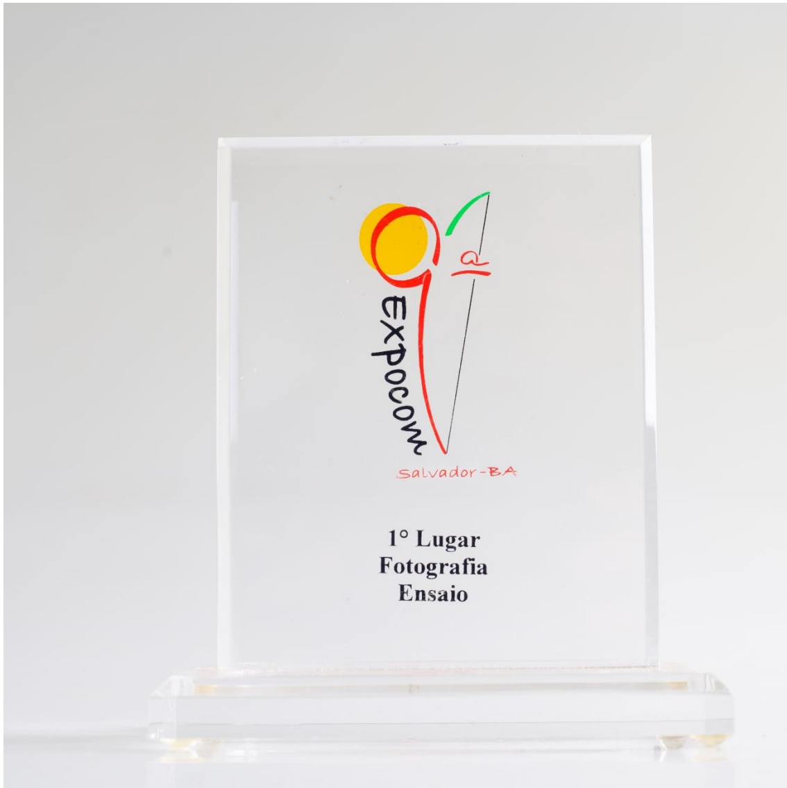
Troféu - Intercom 2013 Fotografia e Ensaio - BA