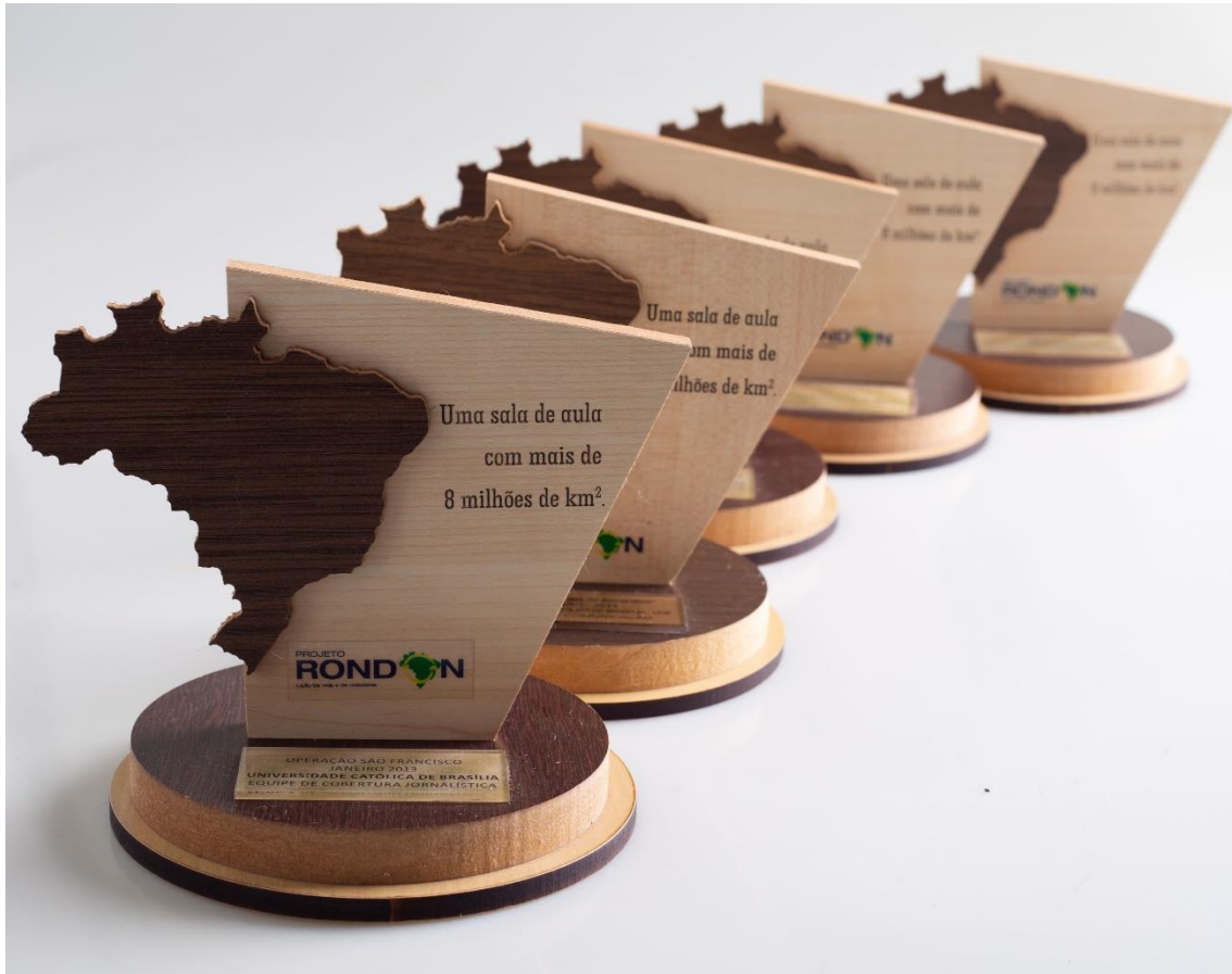
Troféu - Projeto Rondon 2013