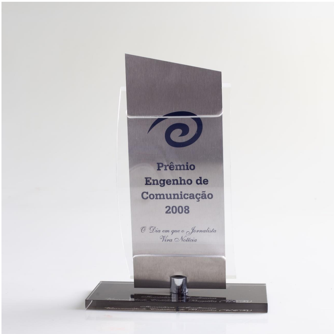
Troféu - Reconhecimento do Projeto Rondon - Equipe de Cobertura 2014