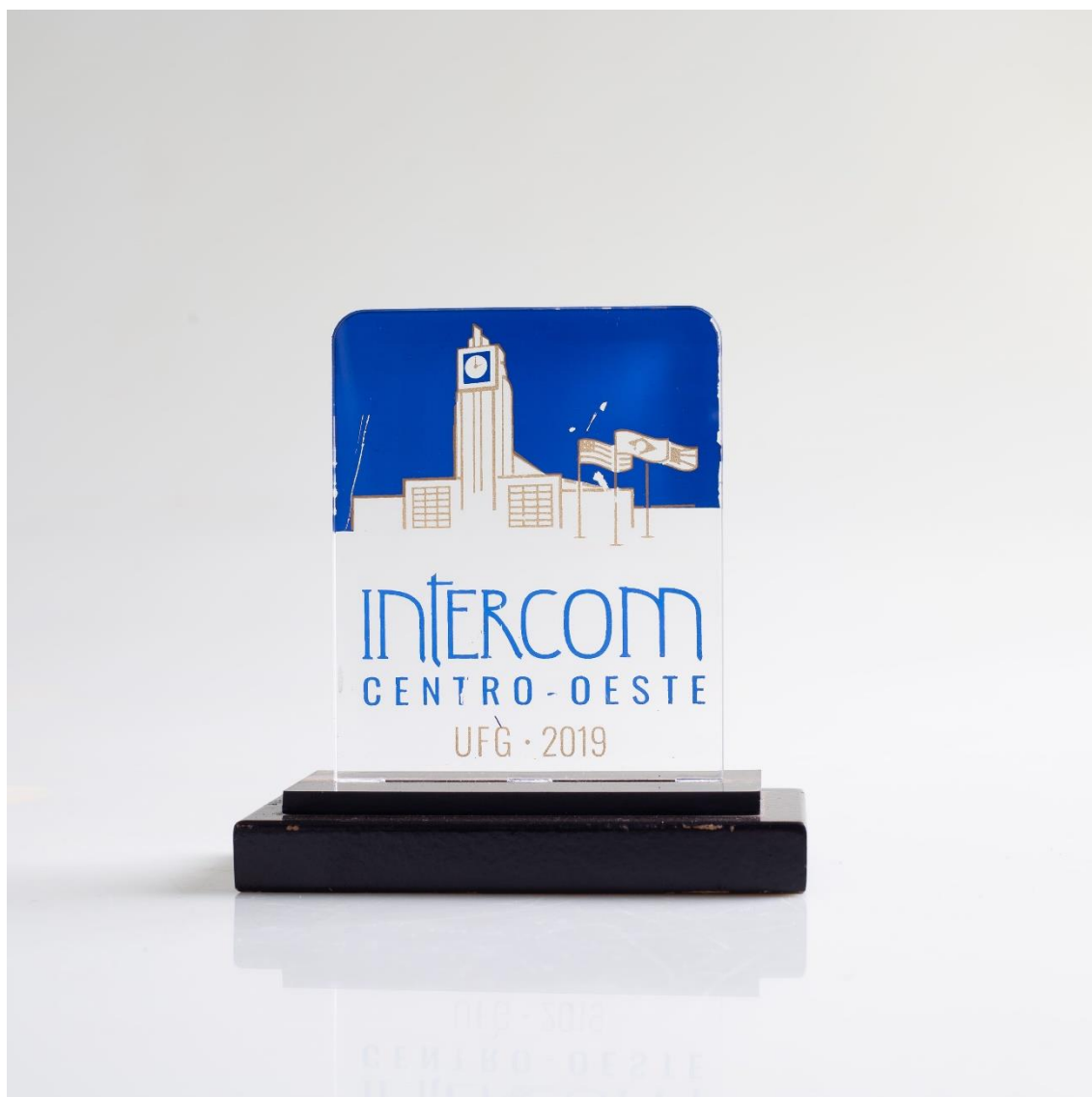
Troféu - Intercom 2019