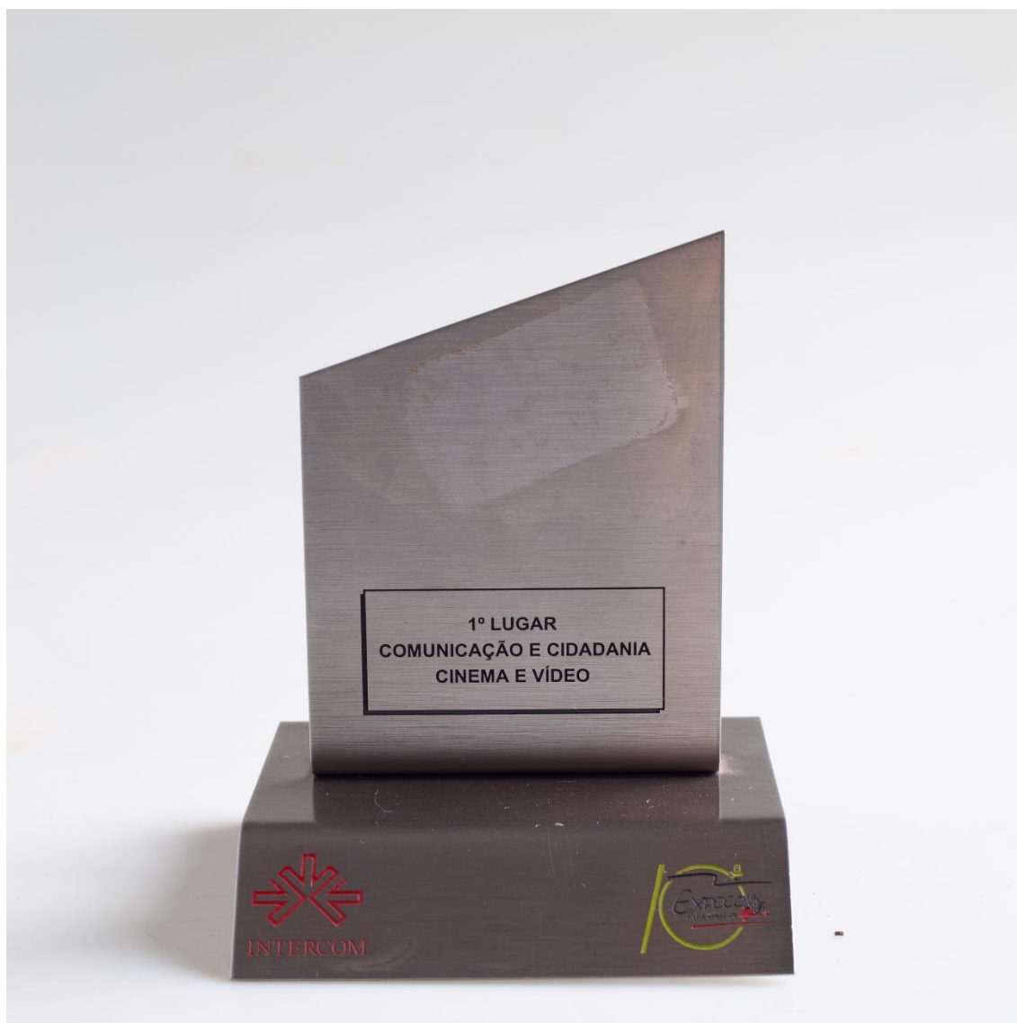
Troféu - Intercom 2018 - 1º Lugar - Comunicação e Cidadania Cinema e Vídeo